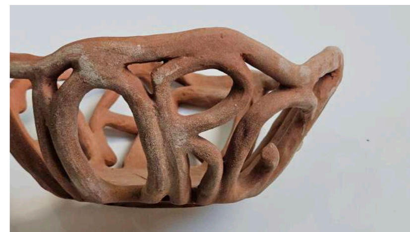
ORGANIZACIÓN Cerámica de arcilla local 22 centímetros de diámetro