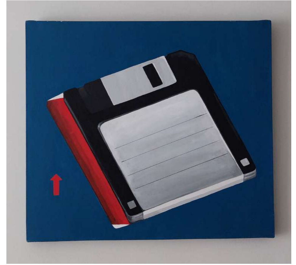
Nicho del olvido Acrílico sobre lienzo 50 x 60 cm