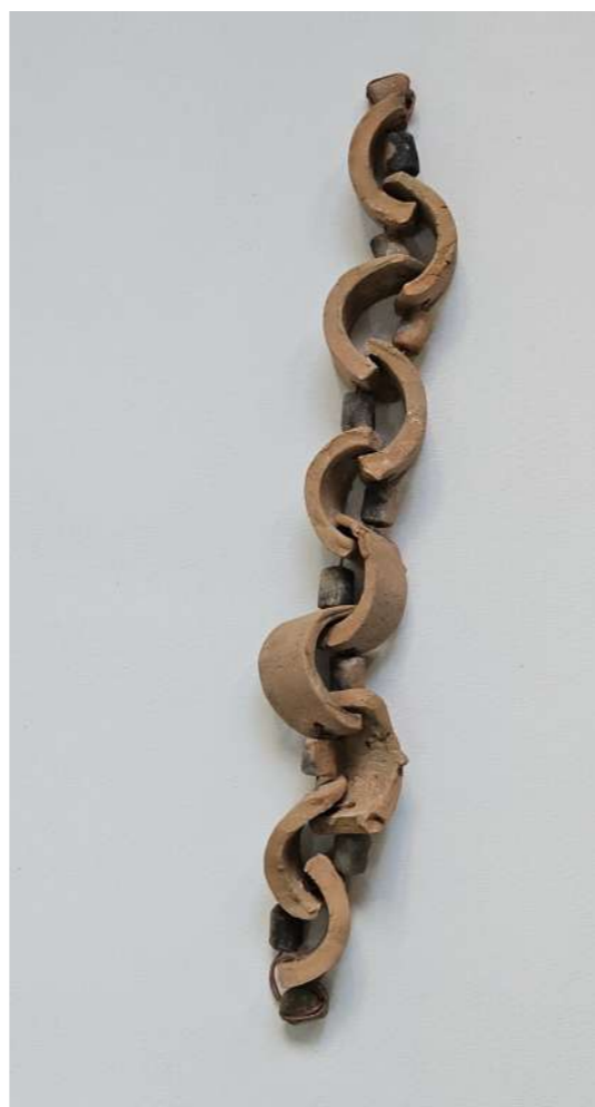
Rotas cadenas Cerámica de arcilla local, hilo chino 38 x 5 x 3 centímetros