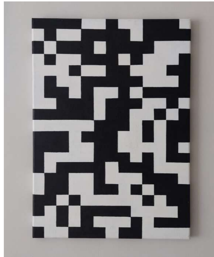
Sin título, de la serie Identidad Acrílico sobre lienzo 50 x 70 centímetros