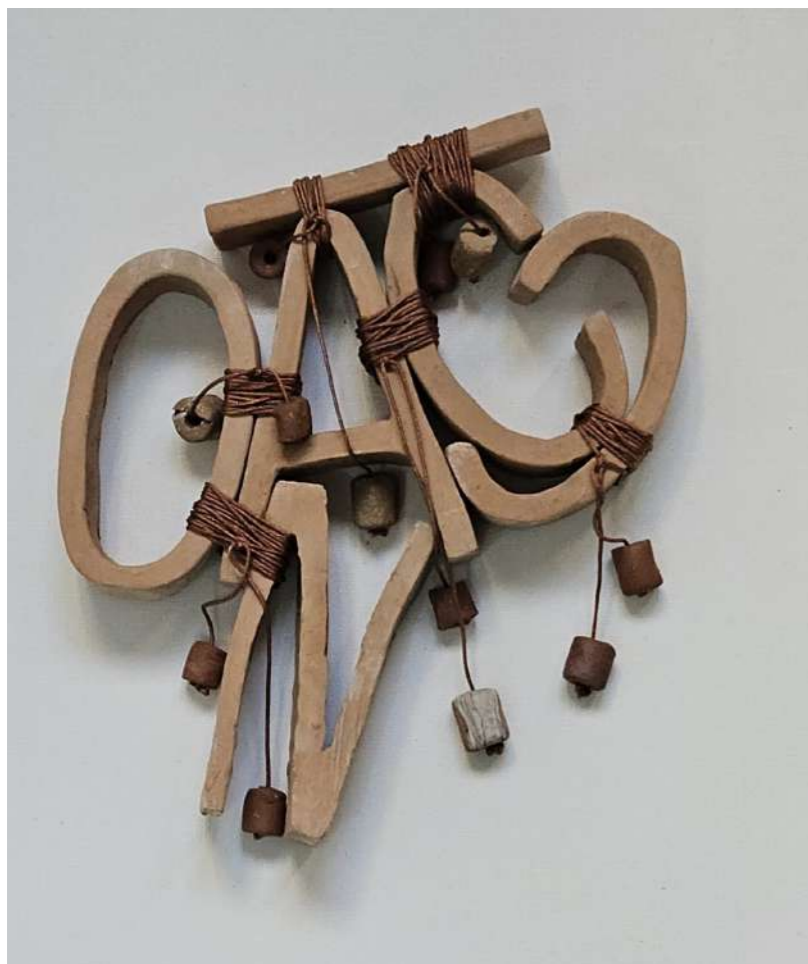
ACCIÓN Cerámica de arcilla local, hilo chino 23 x 17 centímetros