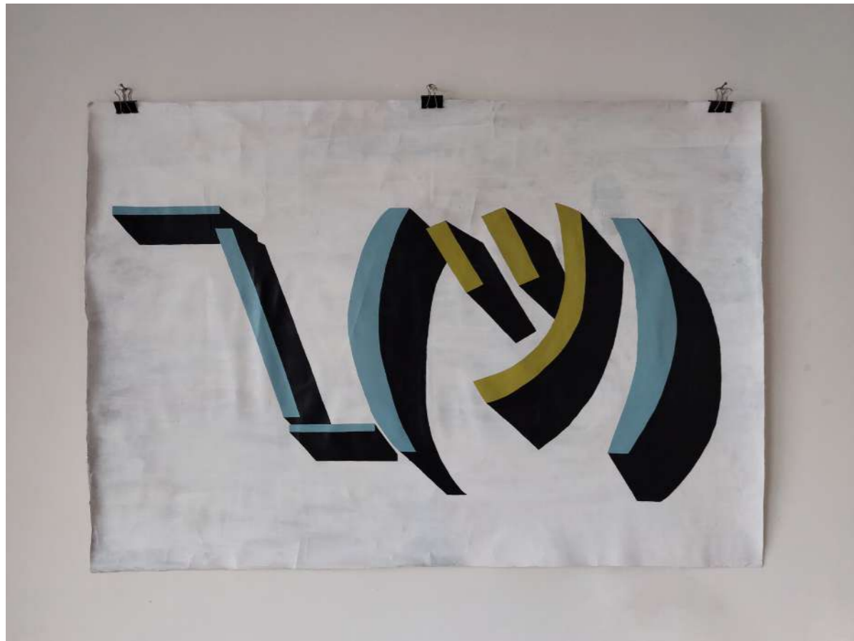
Impertérito Acrílico sobre lienzo (sin bastidor) 100 x 71 cm