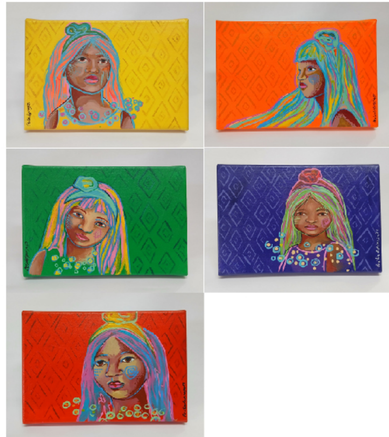
S/T (Serie Celebración)