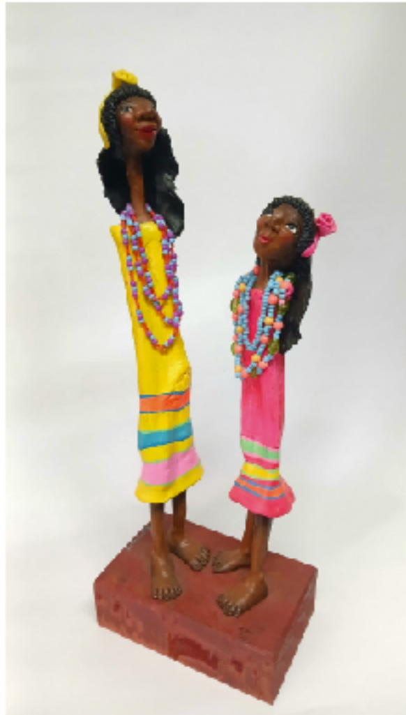
Cuñitas de Calilegua (Serie Celebración)

Artista visual cuyo trabajo se inscribe en la estética y los imaginarios de las yungas. Su práctica articula pintura, escultura, instalación y arte público, explorando la relación entre territorio, materia y simbolismo. Desarrolla una poética atravesada por lo espiritual, el uso del color y la relectura de formas vinculadas a su contexto de origen. Además de su producción artística, se desempeña como docente y gestora cultural, participando activamente en proyectos y acciones en la región.